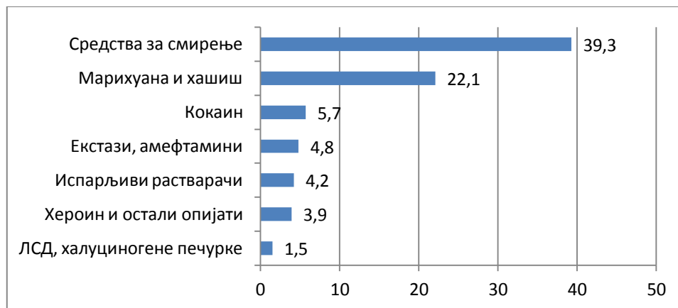
Графикон 6.1: Процент испитаника који познају некога ко користи ПАС по типу супстанце коју користи, Србија (%)

Испитаници су у највећем проценту одговорили да познају особе које користе средства за смирење (39,3%) и марихуану и хашиш (22,1%). Остале супстанце су много мање заступљене (Графикон 6.1).